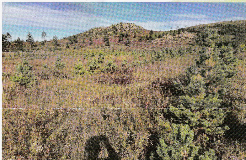
エコフィン「生命の森」WEBサイト https://www.willife.com/ecoffinj/inochinomori.html